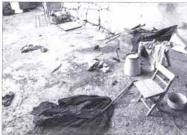
Jedno od poprišta zločina

Županijski državni odvjetnik Željko Žganjer kvalificirao ubojstva kao teška kaznena djela iz koristoljublja / Sedamnaest srpskih civila ubijeni su metkom u glavu, vrat ili trbuh / Nakon čitanja optužnice optuženi su izjavili da se ne osjećaju krivima